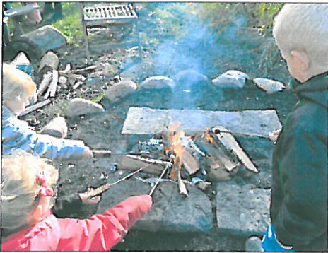
Kan man lave perler af brændt træ? Ja, det kan man. Det blev vist i Eventyrlunden torsdag formiddag.