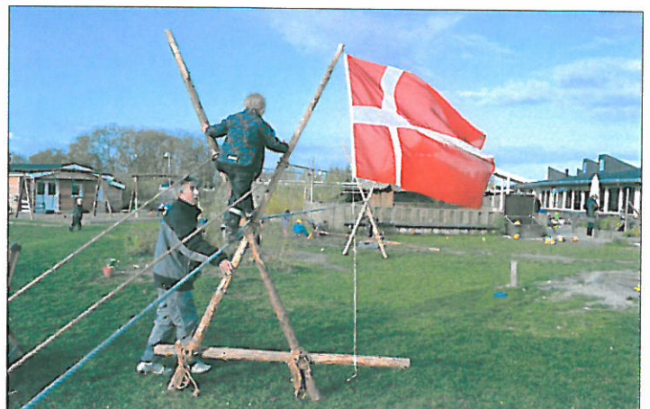
Udfordring på tovbroen. Balanceevnen blev sat på en prøve.